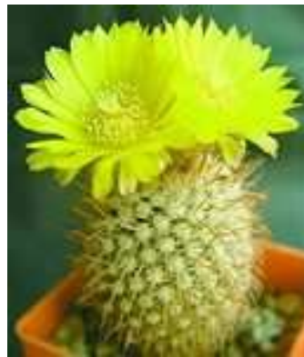
ка кту с